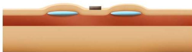
1. Cas figuré de la mise en place de 2 expandeurs de part et d'autre d'une lésion cutanée. Première intervention.

L'expandeur et la valve peuvent être déjà légèrement visibles sous la peau (voussure de la peau).