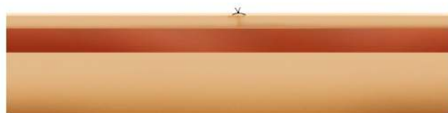
4. Après retrait des expandeurs et exérèse de la lésion, la fermeture cutanée se fait sans tension.