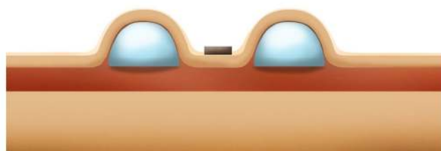
2. Après 2 mois de « gonflage » au sérum physiologique des expandeurs.