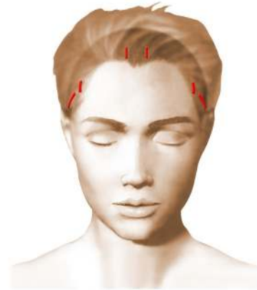
Incisions = cicatrices

Le jour de l'intervention, au moindre doute, un test nicotinique urinaire pourrait vous être demandé et en cas de positivité, l'intervention pourrait être annulée par le chirurgien.